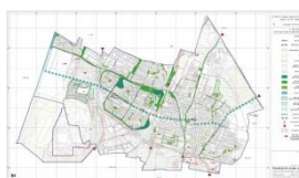
נספח נוף (ראשון לציון)