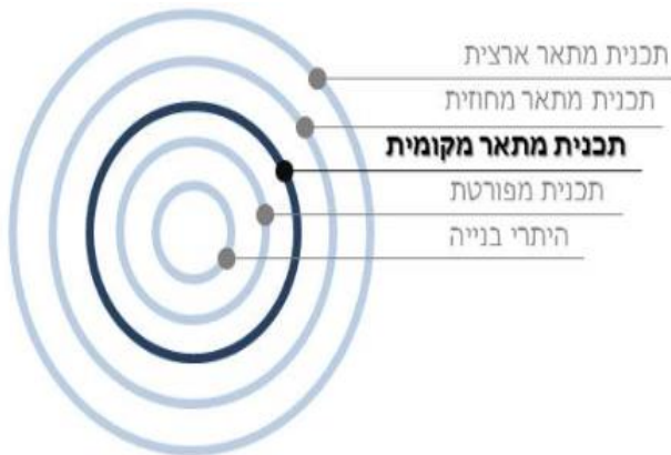
תרשים היררכיית תכניות

לתכנית המתאר לריחניה יש מרחב פעולה גדול אבל היא עדיין צריכה להתאים לתכניות הקיימות בסביבה. התכניות האזוריות שמעליה והתכניות המקומיות שמתחתיה.