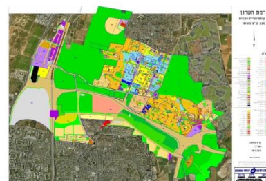
תשריט מצב קיים (רמת השרון)