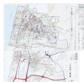
נספח ביוב, תחבורה (חדרה)