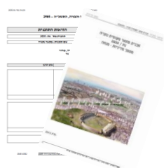
הוראות התכנית ומסמך מדיניות (נתניה)

בסופו של דבר (אחרי תהליך האורך כשנה וחצי) מקבל הכפר 3 תוצרים: תשריט – כלומר מפה של הכפר בצבעים שונים. כל צבע מגדיר ייעוד קרקע אחר (לדוגמה: מגורים, מסחר, מבני ציבור, שטחים פתוחים ועוד). המפה תאפשר לכל תושב לדעת מה העתיד של האזור שלו. תשריט זה מסביר מה מותר לבנות בכל אזור ובאיזה היקף. את הבניה עצמה יזמו ויבצעו בעלי הקרקעות בשטחים הפרטיים ויזמים שונים בשטחים המוגדרים כשטחי מדינה. תקנון – חוברת עבה שכתובה בצורה משפטית המפרטת את הוראות ההתכנית. כאמור, אחרי אישור התכנית התקנון שלה הופך לחוק מחייב. נספחים – מסמכים המפרטים בנוגע לדברים שחייבים לעשות (נספחים מחייבים) בנושאים שונים, כגון: תחבורה, ניקוז, תשתיות ולגבי דברים שכדאי לעשות (נספחים מנחים) בנושאים שונים כגון: (שימור, סביבה וכדומה).